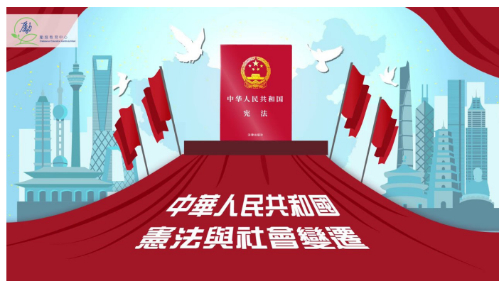
影片生動地介紹國家憲法與社會變遷的關係