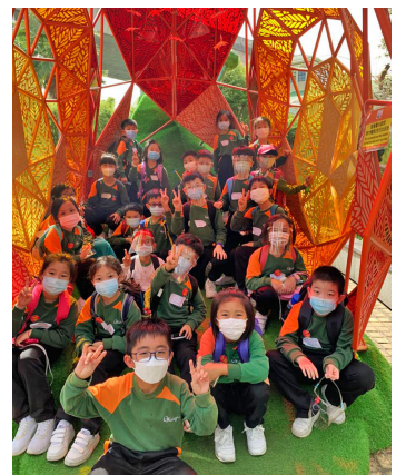
▲3E班同學在馬灣公園來一張大合照

能夠走出課室，到戶外學習，的確是一個難得的機會。雖然戴着口罩，仍掩蓋不住同學們歡樂的笑聲，期望疫情回落，我們可以有更多戶外學習的機會。