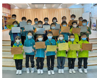
▲香港小學數學奧林匹克比賽獲獎同學