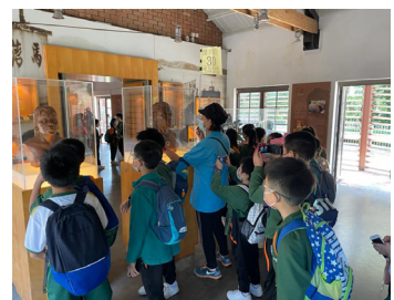
▲同學們正在細心聆聽出土文物發掘過程、搬運、修復及處理方法