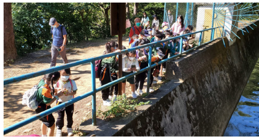
▲同學們正在專注地了解引水道的用處