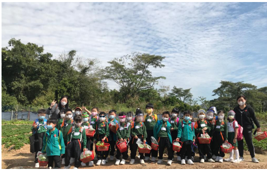
▲每位同學都能把自己親手採摘的蔬菜帶回家好好品嚐

由於疫情關係，我們已很久沒有舉辦過大型戶外活動了，同學們得知今年能參加「全方位學習日」，到不同的地點參觀、學習，無不興奮無比，滿心期待。