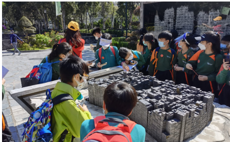
▲同學對九龍寨城這個神秘的地方非常好奇