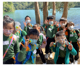
▲來到戶外，同學都掩不住內心的欣喜雀躍