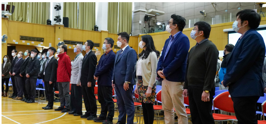
師生在學校禮堂參與升旗禮