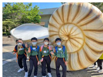
▲你見過這麼大的螺殼嗎？快來拍照留念