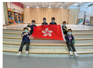
▲WMI Final 2021 本校的香港代表隊