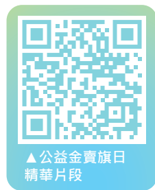
▲公益金賣旗日精華片段

當日天公造美，風和日麗。學生與家長們迫不及待，一早便回到學校領取旗袋，希望可以籌集更多的善款，幫助社會上有需要的人。當日有超過一百四十五個家庭（約四百多人）參與，大家走到將軍澳不同的街道上，家長和小朋友向途人說：「請幫我買旗，一起支持公益金，幫助有需要的人！」開始的時候大家有點害羞，因為疫情令人與人之間的接觸減少了，但同學熟習怎樣做以後，就做得愈來愈起勁，不少學生賣完手上所有的旗才願意離開，最後帶着滿滿的幸福和錢袋完成任務。大家身體力行，為社會貧苦大眾籌款，希望集合優才的力量，在疫症下為社會帶來一絲溫暖。