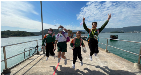
▲同學都非常興奮！準備出發探索

今次，六年級同學的目的地鹽田梓正位於我們學校所屬的區域—西貢，真是這麼近，那麼遠！同學要先到西貢碼頭再轉乘街渡到達小島，一下船已感受到島上的獨特氣息，同學都非常興奮！這小島曾於2015年獲聯合國教育科學文化組織頒發文化遺產保護傑出獎(Awards of Distinction)，同學都努力尋找它值得保育的地方、認識歷史文化以及製鹽的過程。