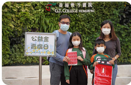
▲家長及同學賣旗前在校門拍照留念