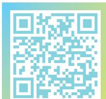
▲G1-G6 全方位學習日精華片段