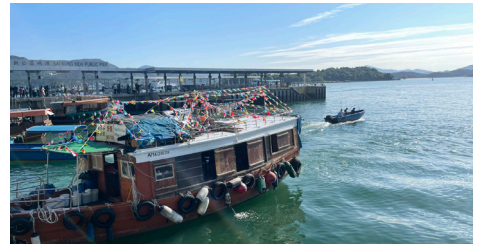
▲陽光為相片加上自然濾光