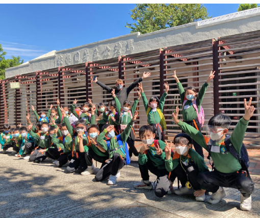
▲3B班在馬灣公立芳園學校前留影