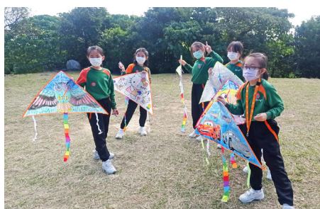
▲同學與自己準備的風箏拍照留念

在天朗氣清的日子，四年級同學到清水灣的大坳門呼吸新鮮的空氣，沿着樹木研習徑慢慢欣賞不同種類的樹木，遠眺對岸的幾個島嶼，不禁令人懷疑自己身處外地呢！那幾個小島分別是：洲群島、橫瀾島、布袋澳等等，同學都驚嘆香港的明媚風光，同學和老師當天一起享受了放風箏的美好時光。相信大家都非常期待下一次的外出，親親大自然！