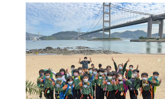
▲難得來到馬灣東灣，當然要與陽光、海灘合照