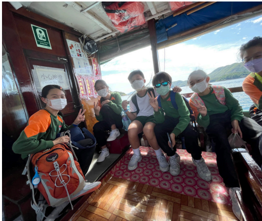
▲同學搭乘充滿特色的街渡到鹽田梓

兩年的疫情已經完全改變了大家的生活模式，疫情嚴峻的時期，連呼吸一口新鮮空氣都變得困難。久違了的戶外學習終於在11月中來臨了，各個年級都能夠和同學、老師一同走出校園，到不同的地方進行全方位學習。當天風和日麗，陽光為每一張相片都加上自然濾光，同學和老師的相機都必定有所收穫。