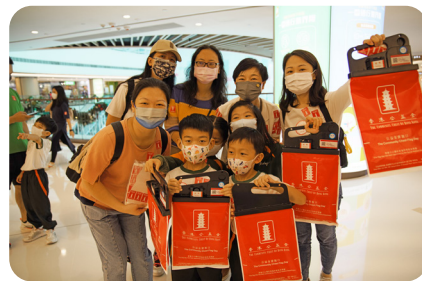
▲大家看見旗袋裝了滿滿的善款都十分雀躍