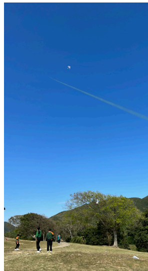
▲天朗氣清的大坳門