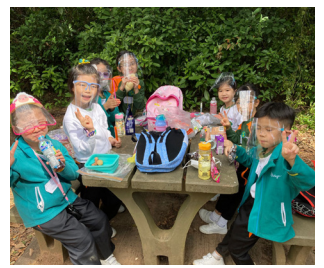
▲同學趁小休時間享受美食