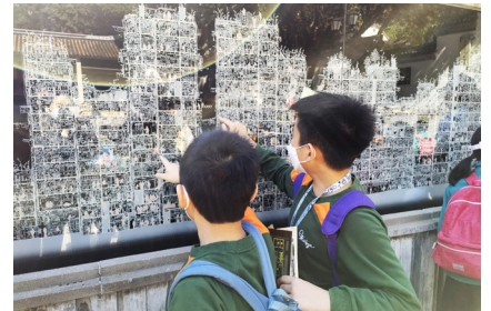
▲同學想像以往寨城居民的生活情況

五年級同學就到九龍寨城公園探究這個曾經是「三不管」的神秘地方！這個只有0.026平方公里的地方就曾經有350棟樓宇，全盛時期更有多達5萬人居住，成為當時全世界人口密度最高的地方，建築界人士都嘖嘖稱奇，難怪連外國人都為之狂熱！