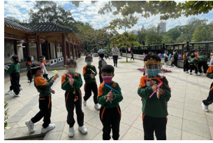
▲同學們在北區公園空地玩竹蜻蜓

當日，初小同學分級進行活動。一年級的同學到四季農莊參觀，除了參觀農田，認識不同的農作物外，還當了半天的小農夫，親手摘生菜。透過耕種的體驗，同學們都體會到農夫們種稻的辛勞，更能感恩與珍惜。