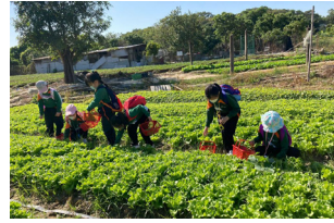
▲同學們正埋頭苦幹地採摘新鮮的蔬菜