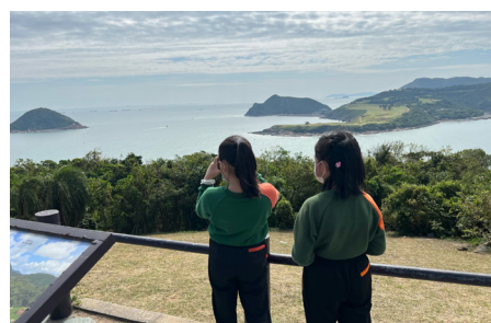
▲遠眺對岸的島嶼，不禁令人懷疑自己身處外地呢