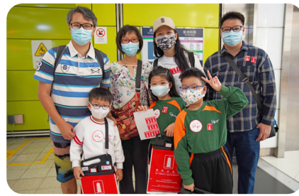
▲家長及同學們全家總動員參加這次的善舉