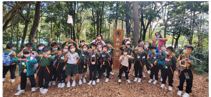
▲2A班同學在白千層夾道前留倩影

二年級的目的地是菠蘿壩自然教育徑，同學們可以親親大自然，呼吸新鮮空氣。領隊和老師們帶領同學進行實地考察，認識本港不同的生態環境及地貌特徵。我們希望透過這次活動，提升同學們的環保意識，並深刻體會愛護大自然的重要。