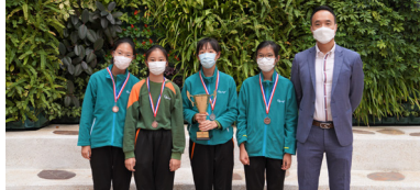
女子甲組得獎運動員(團體殿軍)