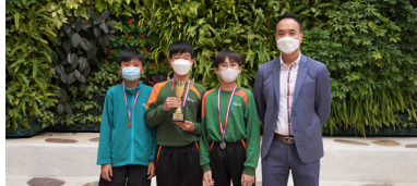
男子甲組得獎運動員(團體優異獎)