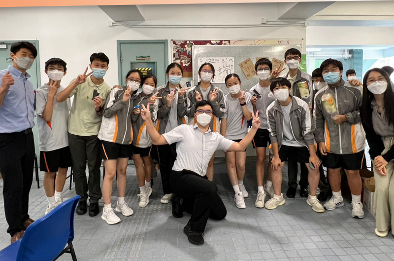
G.T. Green Committee members and Sai Kung Environmental Pioneers working closely for Green Days 2022