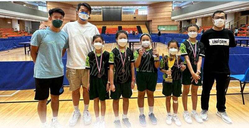
▲ 西貢區校際乒乓球比賽 女子組季軍