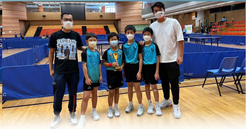
▲ 西貢區校際乒乓球比賽 男子組優異獎