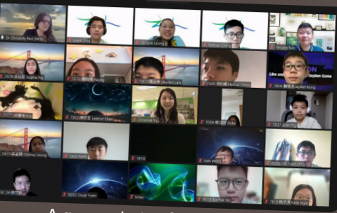
A group photo of all participants in the webinar