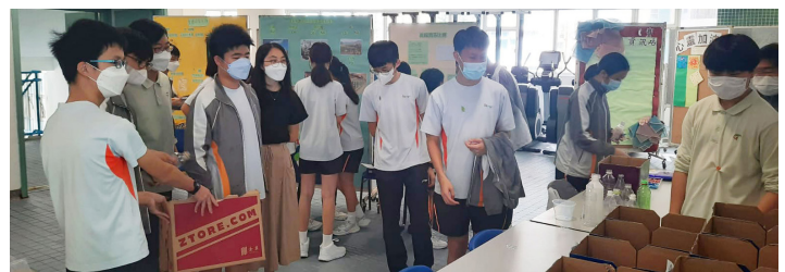
Students throwing the materials into the recycling boxes