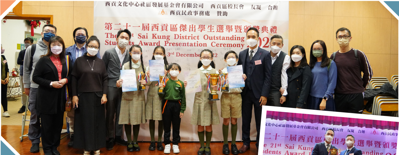
▲ 得獎同學與家長、校長於頒獎會場留影

第二十一屆西貢區傑出學生選舉暨頒獎典禮 The 21st Sai Kung District Outstanding Students Award Presentation Ceremony 2022 3rd December 2022